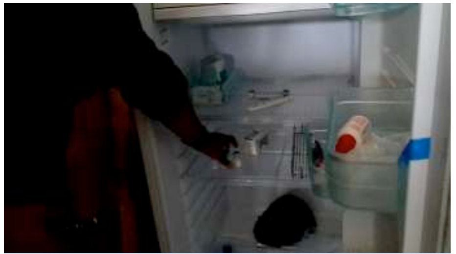
“No hay vacunas para niños” declaró un salubrista del Puesto de Salud de la Aldea Yulba.

“Lo sentimos por la gente que viene (al Puesto de Salud), pero la culpa no la tenemos nosotros, entonces solo les damos recetas y aquí en las comunidades no es lo mismo que estar en un pueblo. En un pueblo la gente puede comprar, pero en las comunidades hay familias que están en extrema pobreza y no tiene (dinero), hay unos que se quedan con la receta y siguen peor con la enfermedad porque no tienen con que comprar (la medicina). Y no solo aquí en el Puesto de Salud, sino en todos, en los 22 puestos de salud que tenemos en Cuilco y nosotros referimos pacientes para el CAIMI (ubicado en la cabecera departamental) y pasa igual. Vienen otra vez con la misma receta porque tampoco hay, estamos mal en todos lados, a nivel de Huehuetenango y nacional.”