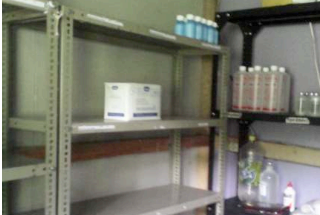
Puesto de Salud del caserío Mujubal, Cuilco. Los trabajadores del Puesto de Salud explicaron que sí han solicitado medicamentos al Ministerio de Salud, pero la medicina nunca llega.

Ante esta situación a las enfermeras, enfermeros y médicos no les queda otra opción más que extender una receta, para que la población compre la medicina que necesita y que no existe en el Puesto de Salud.