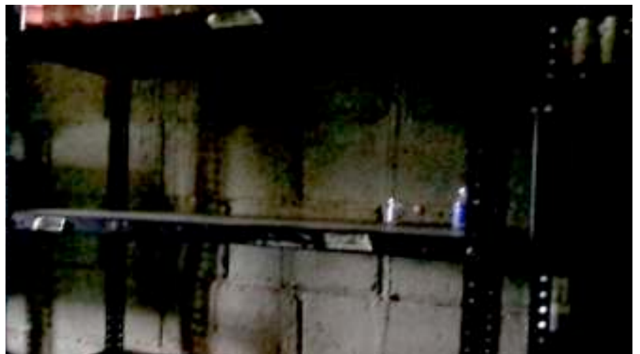
Puesto de Salud ubicado en la aldea Yulba. No hay medicamentos, solamente un poco de Sulfato Ferroso que es para los niños, pero que de todos modos no alcanza.